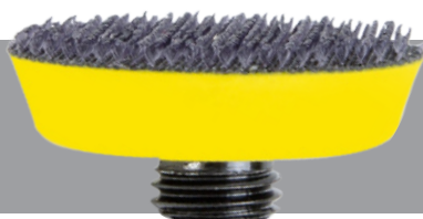
NTools nr 150540 Klette