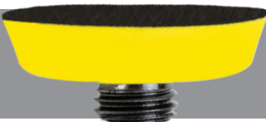
NTools nr 150542 Leim