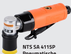
NTS SA 4115P Pneumatische Schleifmaschine für kleine APP nr 139210