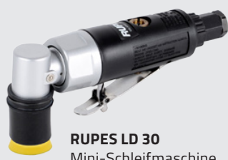
RUPES LD 30 Mini-Schleifmaschine pneumatisch APP nr 131110